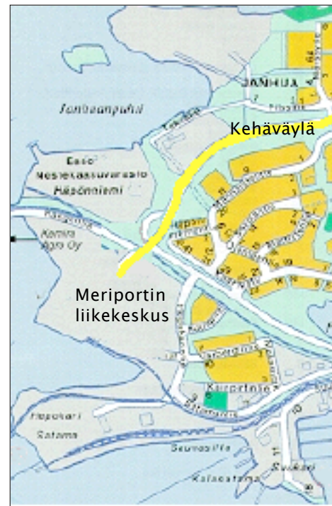
Uudenkaupungin keskusta karttaan on merkittävällä sukkulabussilla keskustaan.

S-marketin siirryttyä pois saattoi kaupunki ostaa tyhjäksi jääneen kiinteistön ja purkaa sen. Tilalle rakennettiin kirjaston tyyliin sopiva puutalo, jossa toimii tietokeskus, eli mediatekki . Siellä ihmiset voivat lukea sähköisiä medioita, mutta myös tavallisia